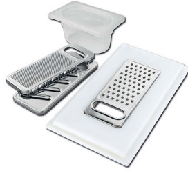
Kit rallador con soporte para anillo y bandeja de recogida de alimentos 8159 101 * sólo en combinación con el accesorio 8644 101