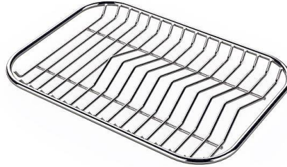
Rejilla portaplatos inox 8100 154