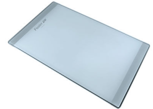
Tabla de corte de cristal 8631 300