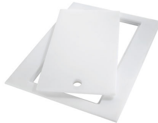
Tabla de corte Twin in HDPE 8644 101